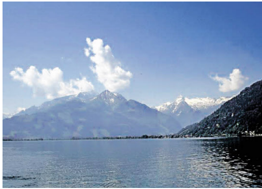
„Wiesbachhorn, Imbachhorn und Kitzsteinhorn vom Zeller See aus“ von Rudi Stadler.