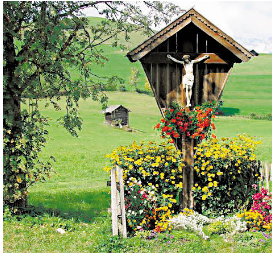
„Wegkreuz“ von Gabriela Heimhofer.