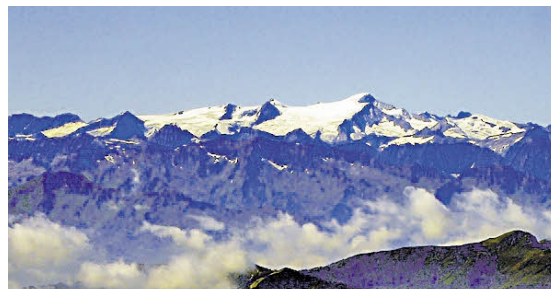
„Großvenediger – überragt fast alles“ von Hannes.